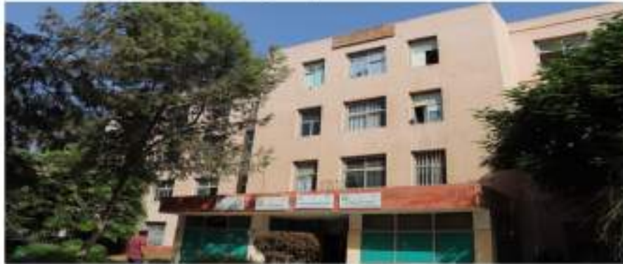
مبنى النبات الزراعي