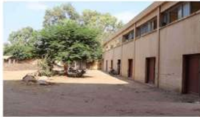
مركز البحوث والتجارب الزراعية

مخازن مركز البحوث : مكاتب ادارية الدور الأول الأرضي : الدور الأول علوى: