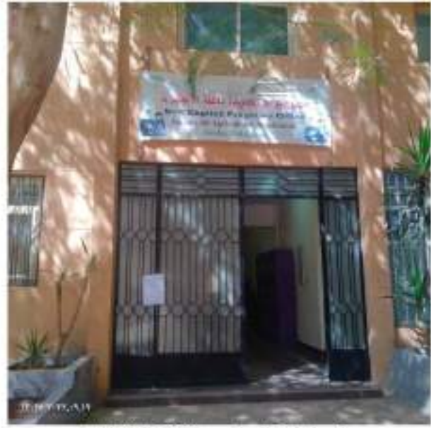
مبنى إدارة البرامج باللغة الإنجليزية

مكتب الأستاذ الدكتور عميد الكلية إدارة المنسقين للبرامج المميزة