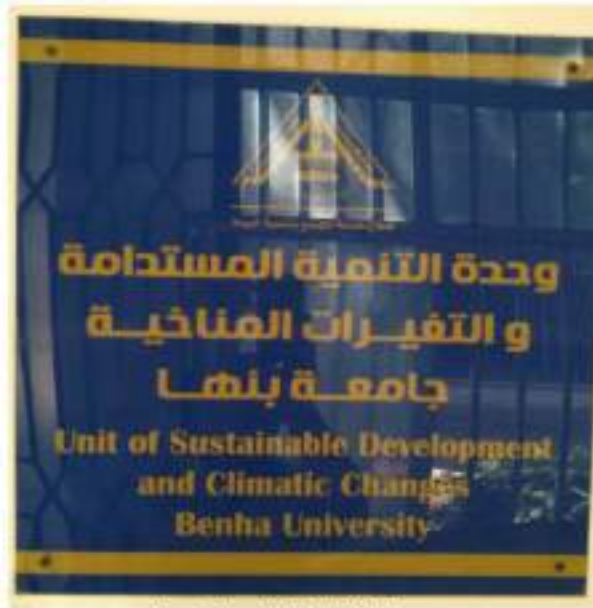
وحدة التنمية المستدامة