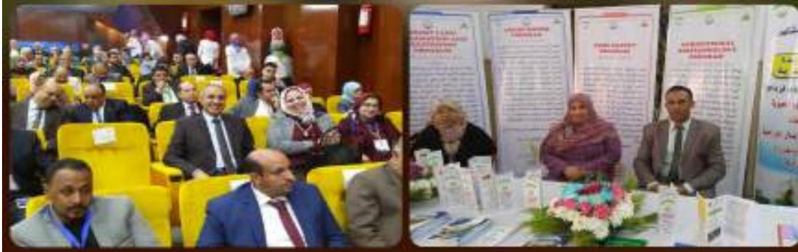
خلال الفترة 22-23 / 1 / 2019 شاركت كلية الزراعة بمشهر في المؤتمر الدولي لتطوير التعليم العالي في ضوء المتغيرات و المعايير العالمية .