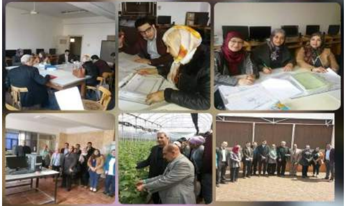
يوم الثلاثاء الموافق 2019-3-5 استقبلت الكلية لجنة المتابعة الخارجيه لتنفيذ الخطة الاستراتيجية للكلية برئاسة أ.د/محمود عابد أبوالروس وكييل كلية الطب البيطري لشئون الدراسات العليا والبحث العلمي