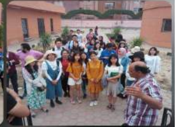
يوم الخميس الموافق 2019-5-2 أقيم حفل ختام الأنشطة الطلابية وتنصيب الاتحاد وعشيرته الجواله