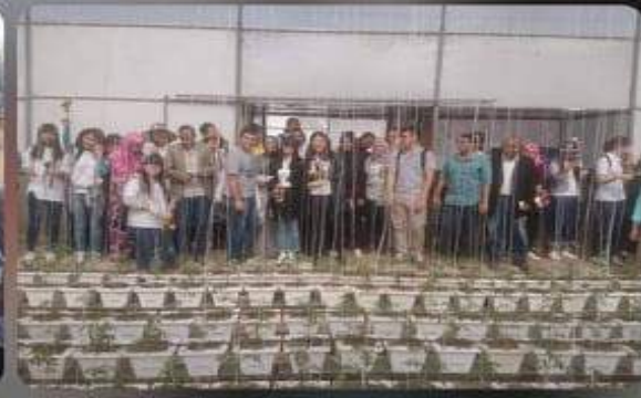
يوم الاثنين الموافق 5-11-2018 استقبلت كلية الزراعة وفد طلابي من جامعة بكين. الصورة*