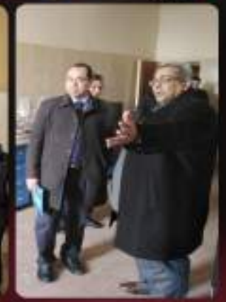
يوم الثلاثاء الموافق 2019-3-5 استقبلت الكلية وفدا من المتدربين في مبادرة صناعية مصر وعددهم أربعون مشترك.