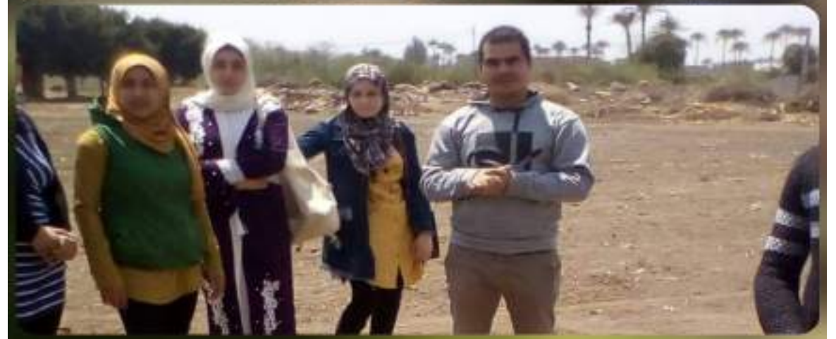
يوم الأحد الموافق 14 / 4 / 2019 استقبلت الكلية زيارة فريق مراجعة الجودة والأعتماد للبرامج الجديدة البيوتكنولوجي وبرنامج امن وسلامة الغذاء